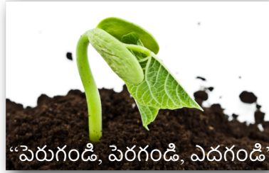
“పెరుగండి, పెరగండి, ఎదగండి”

శారీరక ఎదుగుదల సహజంగా వస్తుంది అంటే మన ప్రణాళిక లేకుండా.