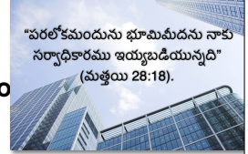
"పరలోకమందును భూమిమీదను నాకు సర్వాధికారము ఇయ్యబడియున్నది" (మత్తయి 28:18).

మరియు వారు ఆయనను చూసినప్పుడు, వారు ఆయనను ఆరాధించారు; కానీ కొన్ని సందేహాలు ఉన్నాయి. మరియు యేసు వచ్చి వారితో ఇలా అన్నాడు, "పరలోకంలో మరియు భూమిపై నాకు సర్వాధికారాలు ఇవ్వబడ్డాయి" (మత్తయి 28:16-17).